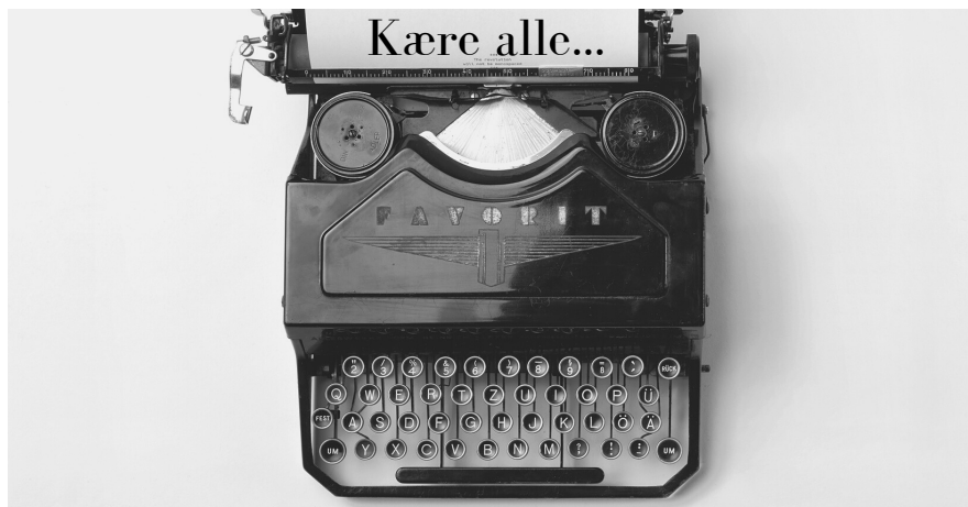
Nyheder i flere former

Prisgrupper Nyhedsbreve A, B, C skrevet fra bunden.